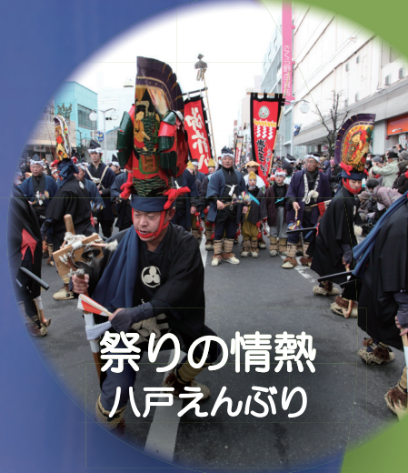
祭りの情熱 八戸えんぶり