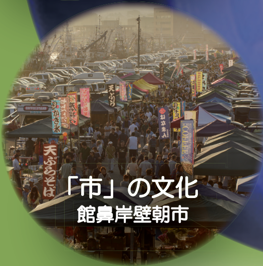
「市」の文化 館鼻岸壁朝市