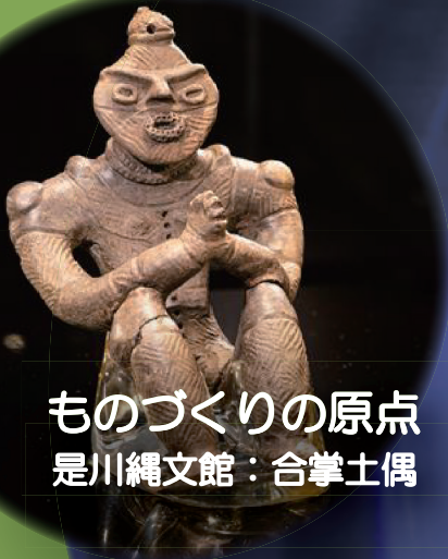
ものづくりの原点 是川縄文館：合掌土偶