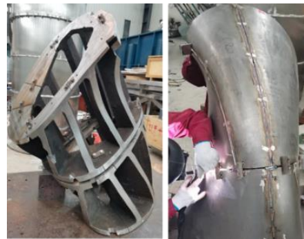
図 2 組み立て用の型と薄板の溶接の様子

端フランジやポートなどの部品を溶接した後、レーザートラッカーによる 3 次元測定を行なった。図 3 にフランジ取り付け後の Type-A と 3 次元測定結果の一例を示す。測定の結果、設計値からのズレは薄板表面で 4.66 mm、水平ポートで 4.3 mm であり、真空容器の目標精度の 10 mm 以下となった。よって、現状の製作方法で、CFQS 主要機器の組立てが可能である見通しが立った。