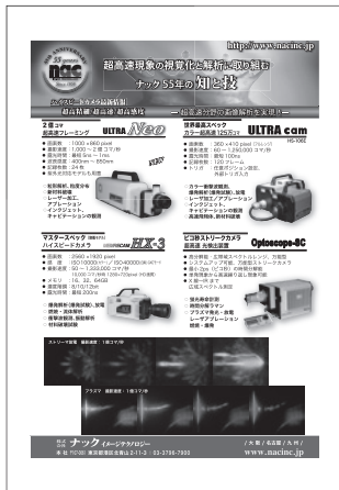
(株)ナックイメージテクノロジー nac image technology inc.