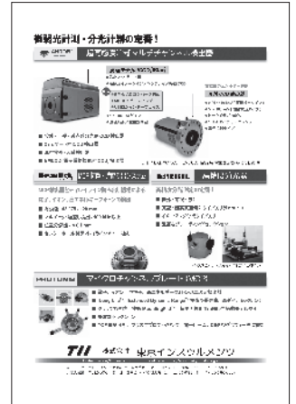
(株)東京インストルメンツ TOKYO INSTRUMENTS, INC