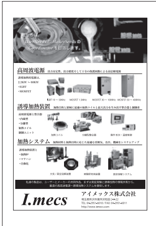
アイメックス(株) I.mecs Co., Ltd.