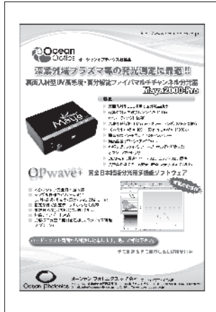
オーシャンフォトニクス(株) Ocean Photonics, Inc